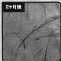
細毛が現れ、毛髪密度がアップ!