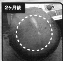
頭頂部に産毛が生えてきた!