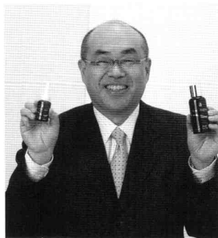
「これからもずっと続けます!」と照れながらもナノインパクトを手笑顔で語ってくださいました。